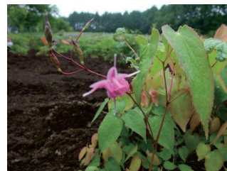
イカリソウ (薬草見本園)