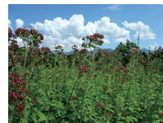
オレガノ (ハーブ見本園)