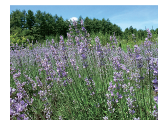
ラベンダー (ハーブ見本園)