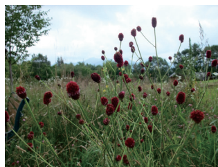
フレモコウ (自然園)