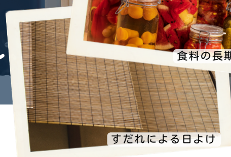
すだれによる日よけ