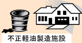
不正軽油製造施設