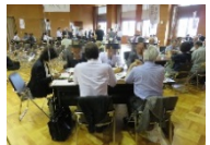
地域企業とシニア人材による交流会(佐久)

(H28年度までの主な成果) ・シニア活動推進コーディネーター相談件数：延2,692件 (H28.12) ← 延2,403件 (前年同期) ・障がい者の就業相談数：1,161件 (H28.11) ← 842件 (前年同期)