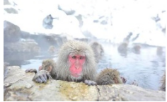
外国人旅行者に人気の雪モンキー