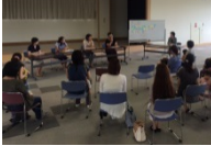
育休復帰経験者との交流会

(H28年度までの主な成果) ・インターンシップ利用者数：134人 (H28.12) ← 69人 (前年同期) ・子育て中の女性の就職者数：295人 (H28.12) ← 167人 (前年同期)