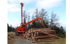
高性能林業機械による高効率な木材搬出システム