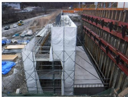
橋台工事施工状況