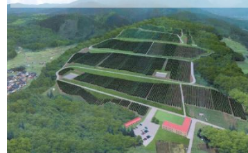
ワイン用ぶどう畑 イメージ図