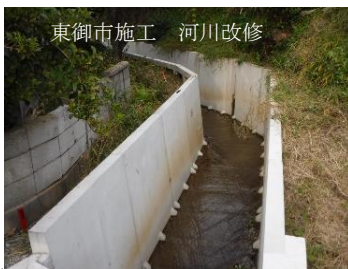
東御市施工 河川改修