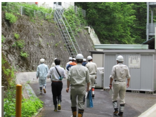
安全確認などの打合せを行い点検箇所へ向かいます。

点検は4市町村、26箇所で行われ、結果は指摘箇所0箇所、定期監視必要箇所12箇所でした。6月29日のパトロールの様子はNHK長野放送局のニュースで放送されました。