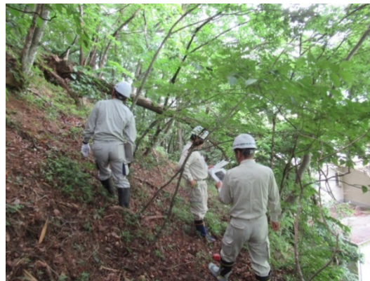
土砂や立木などの崩落状況を調査します。