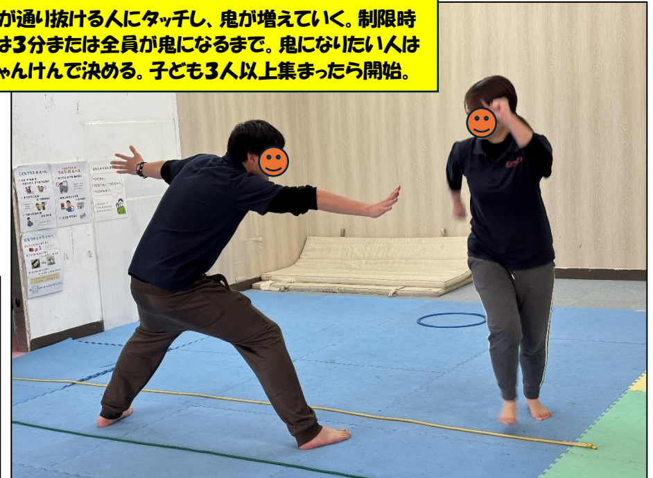
【通り抜け鬼平面図】

鬼が通り抜ける人にタッチし、鬼が増えていく。制限時間は3分または全員が鬼になるまで。鬼になりたい人はじゃんけんで決める。子ども3人以上集まったら開始。