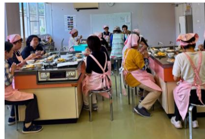
<食改員の活動の様子>