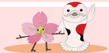
キルシェ カルプ 東信教育事務所キャラクター