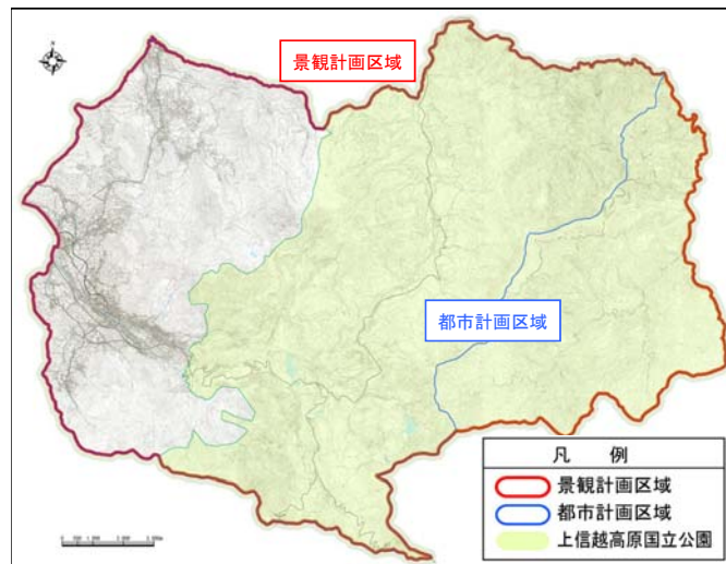
山ノ内町の景觀計画区域(案)