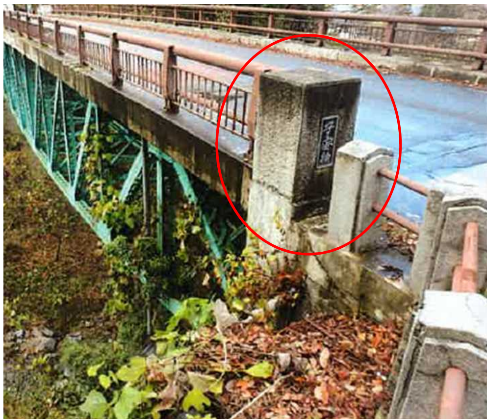
平成29年（撮影）の子安橋

本年度の橋梁補修工事に伴い、親柱（橋梁上部の四隅に設置された太い柱）の「復元」にとりかかります。