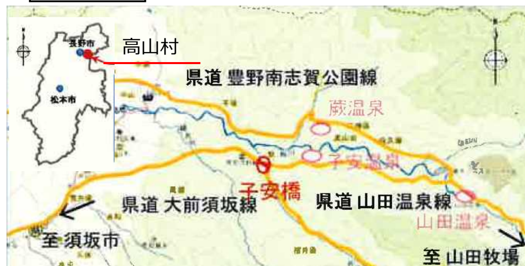
信州くらしのマップより

子安橋は、昭和8年(1933年)に建設され、完成後85年以上経過した、歴史あるトラス橋です。この形式は、上路曲弦プラットトラス橋と呼ばれ、国内でも類似例は少ない珍しいものです。近くには子安神社があり、高山村の温泉郷や素晴らしい景色の松川溪谷へとつながる橋です。