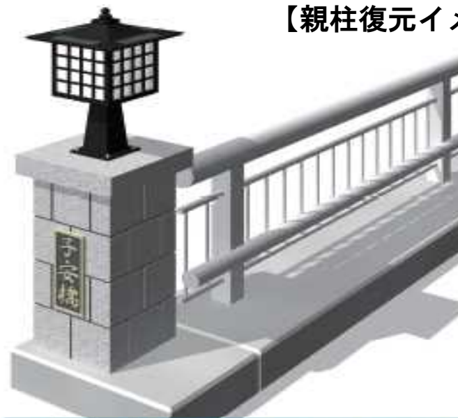
【親柱復元イメージ図】