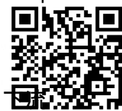
下流親水公園 （発電所見学）