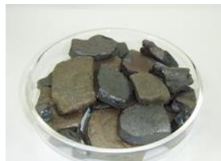
敷材として使用した石材