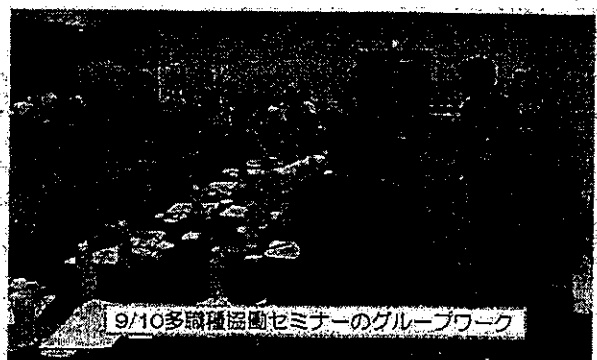
9/10多職種協働セミナーのグループワーク

◆事業分野の凡例 ①在宅医療・介護連携推進事業 □ 医療介護連携 ②生活支援体制整備事業 □ 生活支援 ③認知症総合支援事業 □ 認知症支援 ④地域ケア会議推進事業 □ 地域ケア会議