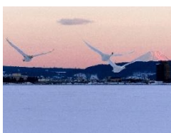
「諏訪湖創生ビジョン」フォト・イラスト作品入賞作品より