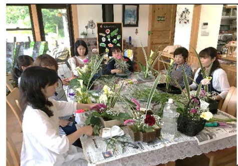
【移住者交流会 地元の花をステキに生けよう】