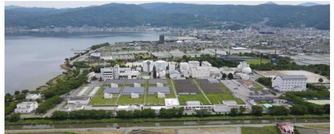
諏訪湖の浄化に大きく寄与したクリーンレイク諏訪

家庭や工場から河川を通して諏訪湖に排水されていた汚水が、下水道を流れクリーンレイク諏訪できれいな水にされたことにより、諏訪湖の水質はだいぶ改善されてきました。