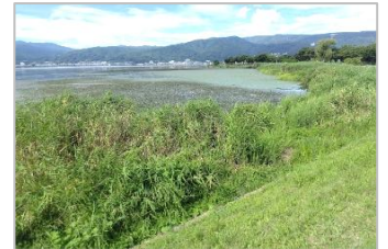
この付近は洪のエゴと言われ生物が豊富