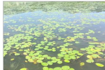
洪のエゴ付近に広がるアサザの群落