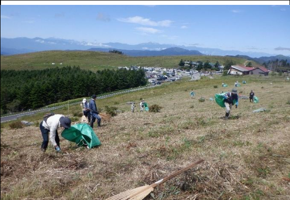
ニッコウザサ搬出作業