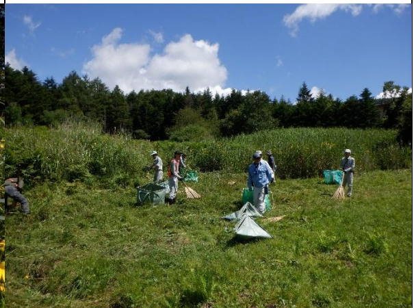
オオハンゴンソウ駆除作業（刈取）