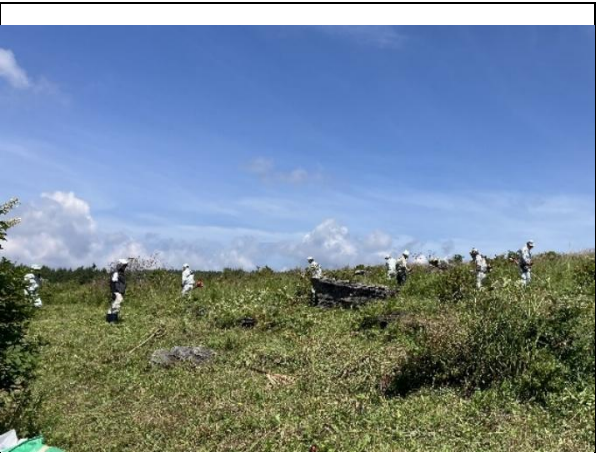
ススキ刈取・運搬作業