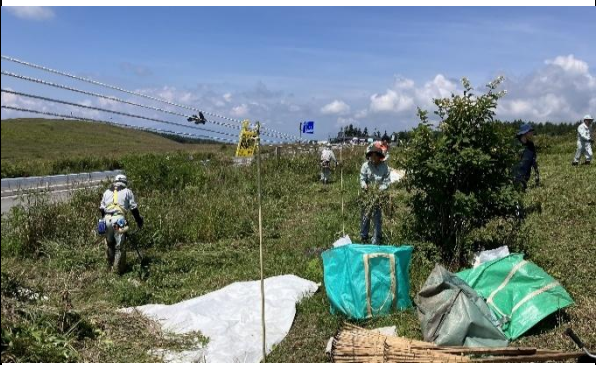
ススキ刈取・搬出作業