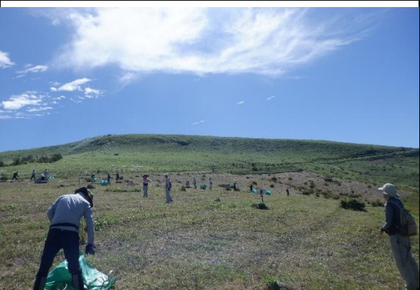
ニッコウザサ搬出作業