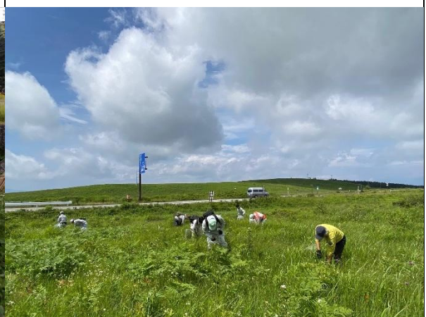
ヘラバヒメジョオン駆除作業