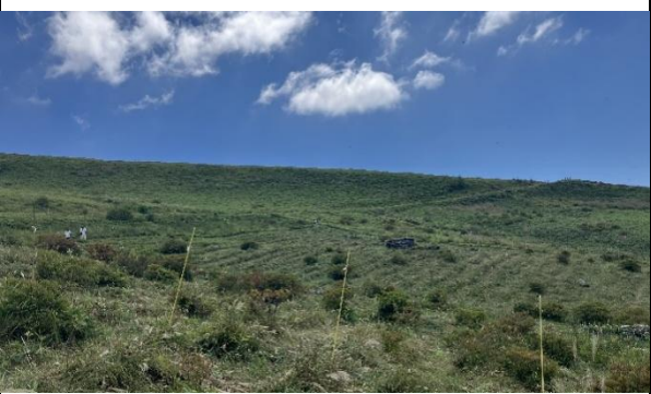
ニッコウザサ刈取作業