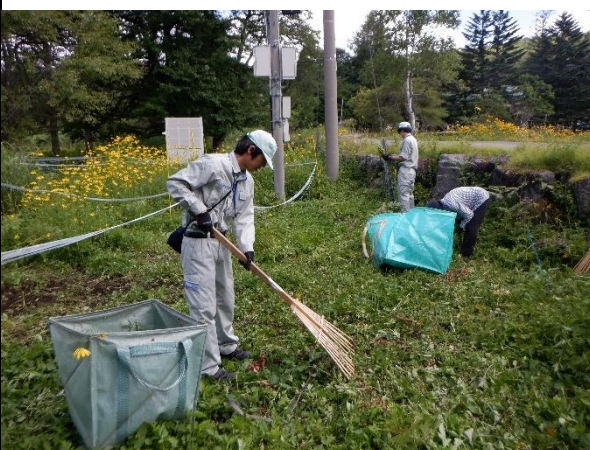
オオハンゴンソウ搬出作業