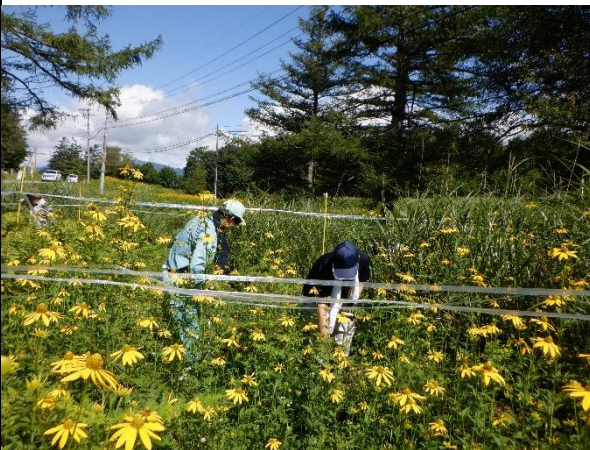
オオハンゴンソウ駆除作業（堀取）