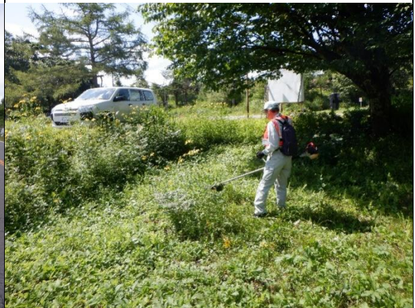
ヘラバヒメジョオン・フランスギク駆除作業