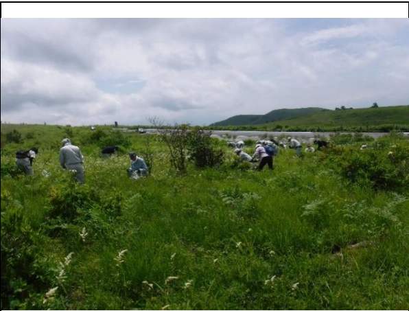
ヘラバヒメジョオン駆除作業