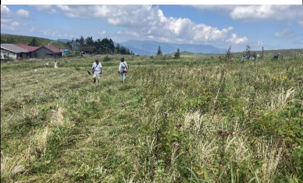
ニッコウザサ刈取作業