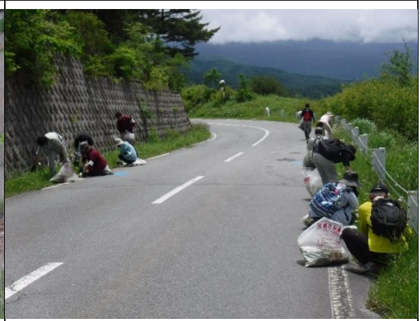
ハルザキヤマガラシ駆除作業