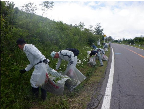
ヘラバヒメジョオン・フランスギク駆除作業