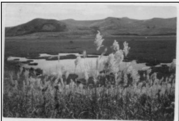
昭和30年頃 八島ヶ原湿原