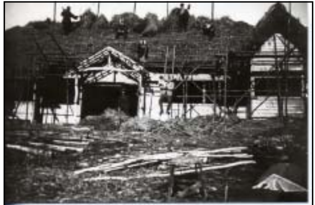
昭和8年 八嶋山荘新築風景 (下諏訪町産業観光課 所蔵)