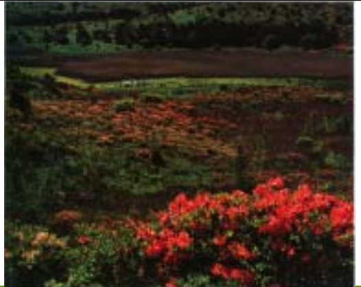
昭和56年 踊り場湿原 (諏訪市教育委員会 所蔵)