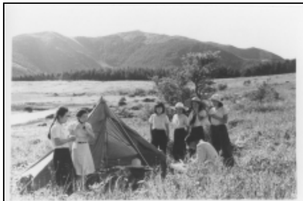
昭和24年 八島奥霧