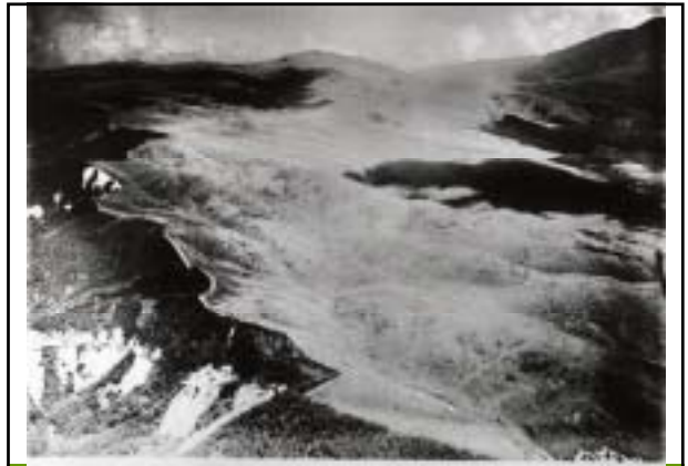
昭和9年 茅野市北大塩方面から見た霧ヶ峰