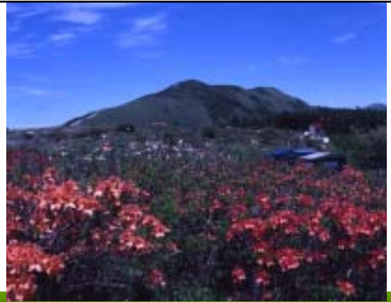
昭和53年 霧ヶ峰を望む