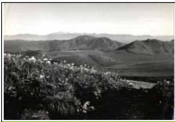
昭和20年頃 八島ヶ原湿原 (ロベンドビュッテ 所蔵)