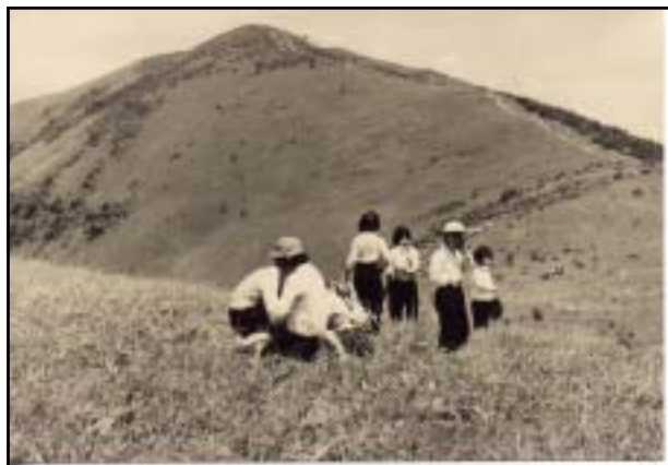
昭和40年頃 鷲ヶ峰周辺