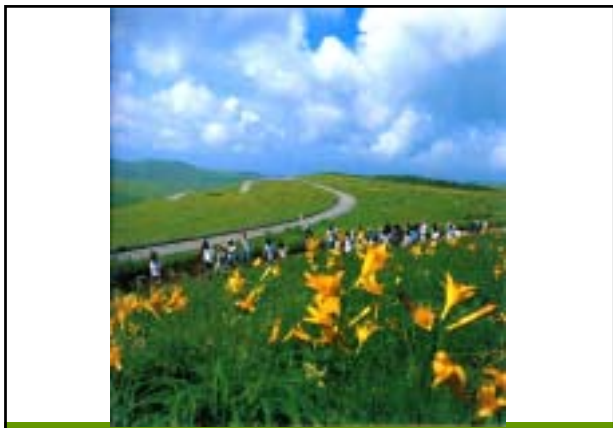
昭和56年 車山肩