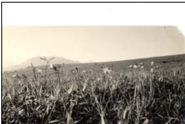
昭和20年頃 南の耳(裏の山は鷲ヶ峰)