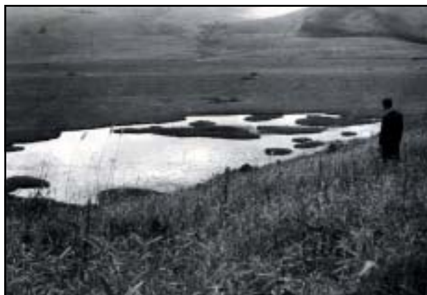
昭和33年頃 八島ヶ池