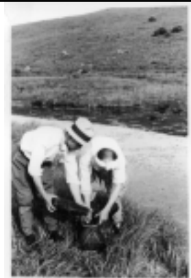
昭和24年 池のくるみ (下諏訪町産業観光課 所蔵)