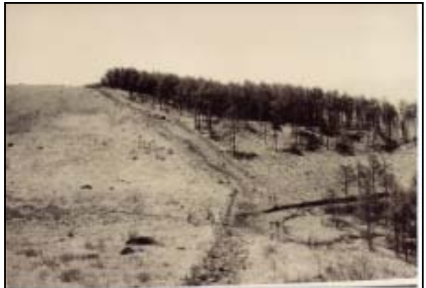
昭和34年以前 八島駐車場周辺