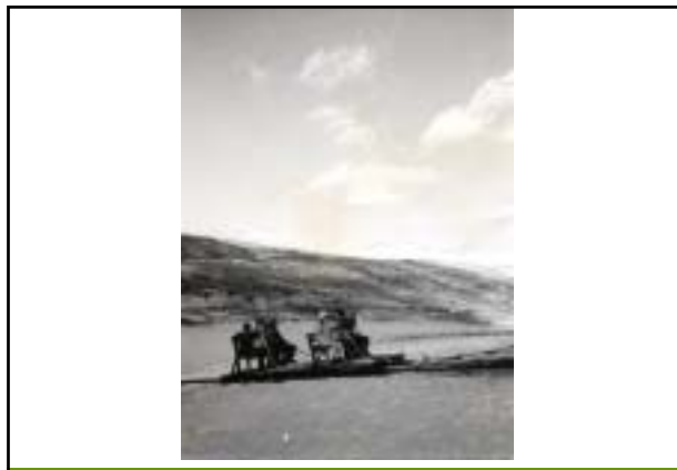
昭和40年頃 池のくるみ