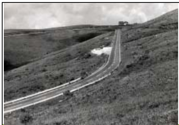
昭和50年頃 車山肩