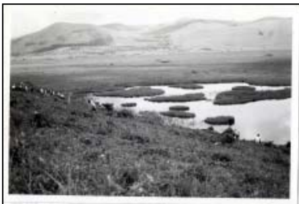
昭和35年 八島ヶ原湿原