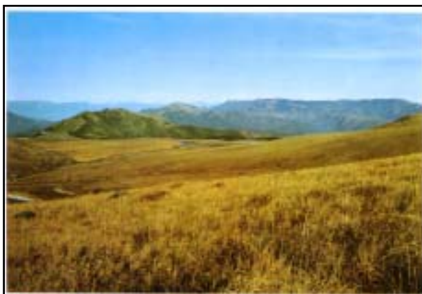
昭和46年 車山下から八島ヶ原を望む