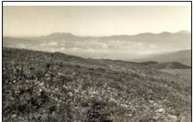
昭和20年頃 車山肩