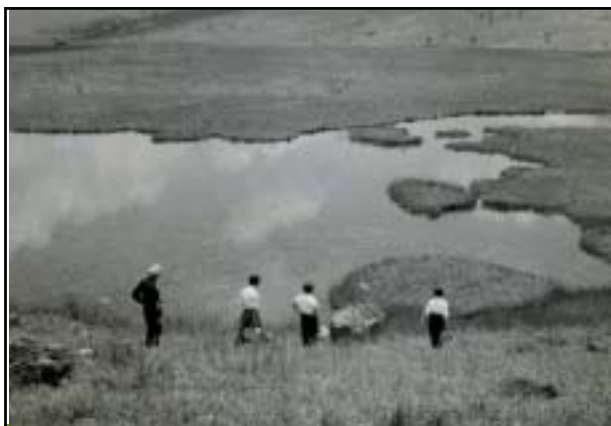
昭和33年頃 八島ヶ池