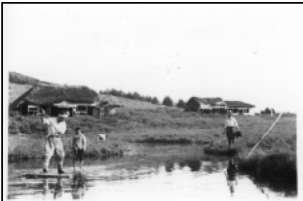
昭和24年 八島ヶ池