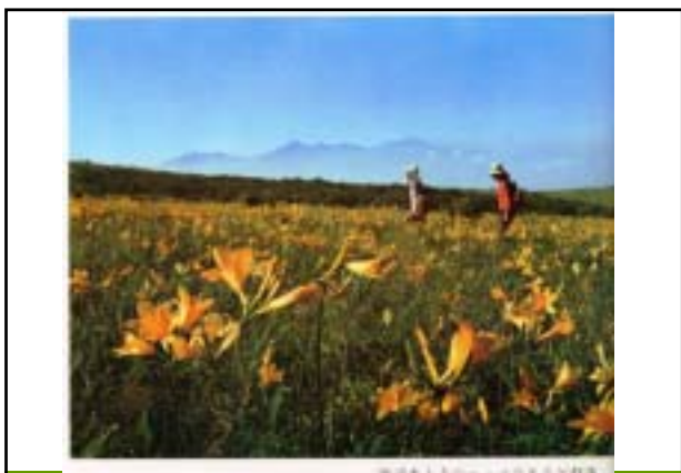
昭和46年 強清水上方のニッコウキスゲ