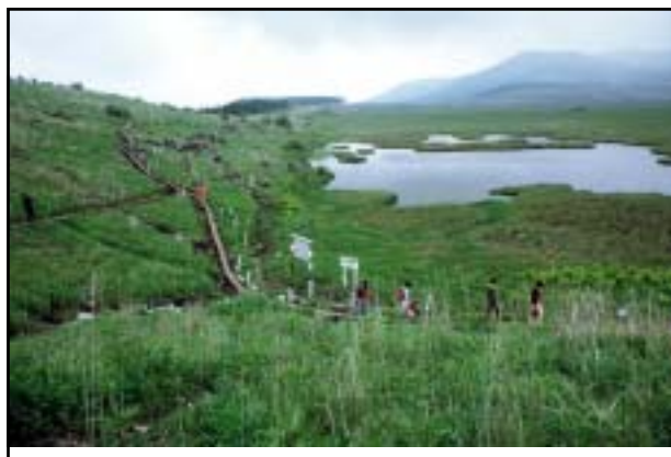
昭和47年頃 八島ヶ池