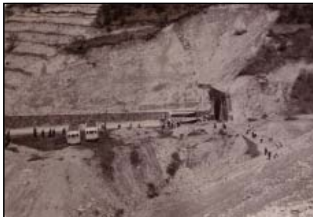
昭和30年 和田峠トンネル