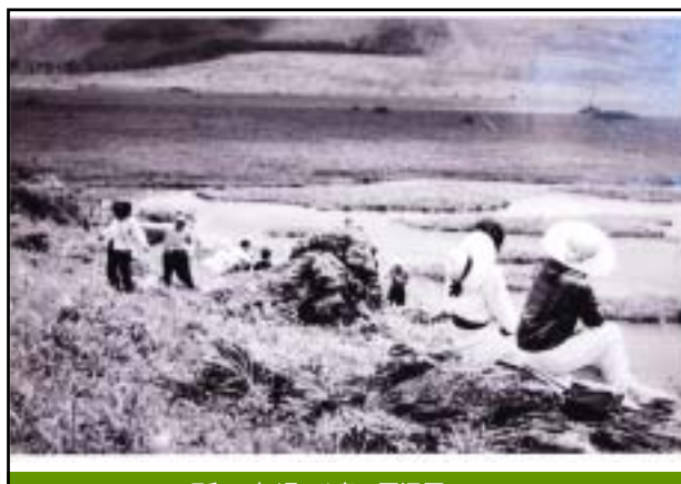
昭和36年頃 八島ヶ原湿原 (下鴨訪町産業観光課 所蔵)