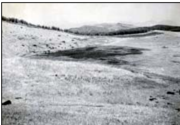
昭和33年頃 八島ヶ原湿原 (下鴨訪町教育委員会 所蔵)