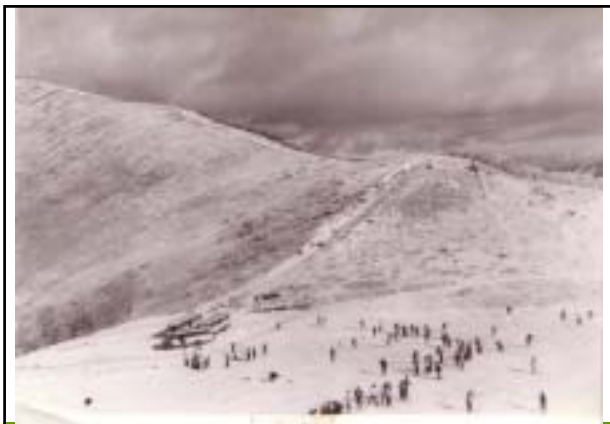
昭和38年 鷲ヶ峰 八岳スキー場