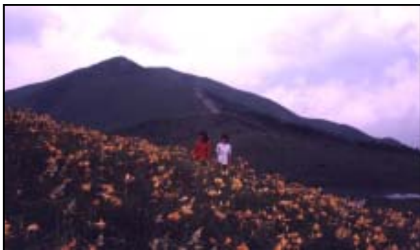
昭和53年 七島八島周辺 (下諏訪町産業観光課 所蔵)