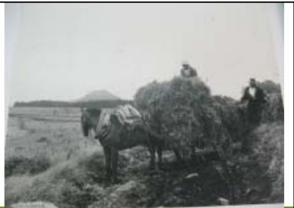
昭和25～26年 八島ヶ原湿原周辺