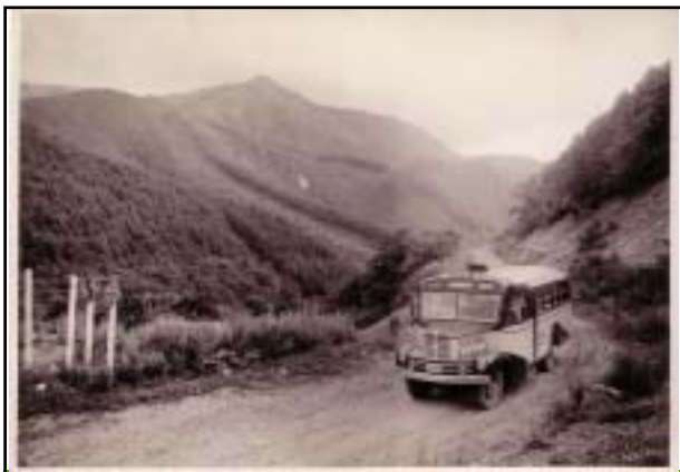
昭和28年 和田峠～下諏訪町