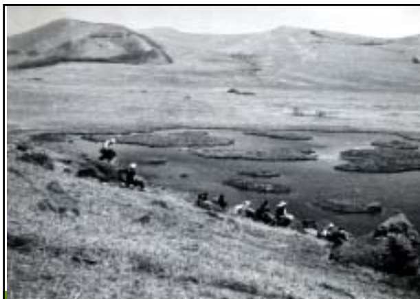
昭和33年 八島ヶ原湿原付近 (下鴨訪町教育委員会 所蔵)