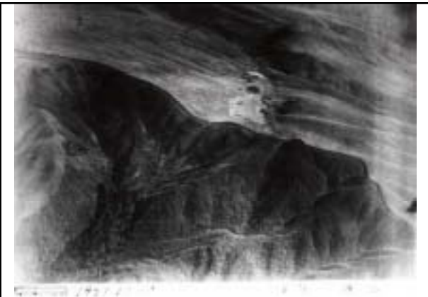
昭和9年 池のくるみ