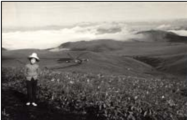
昭和20年頃 車山肩