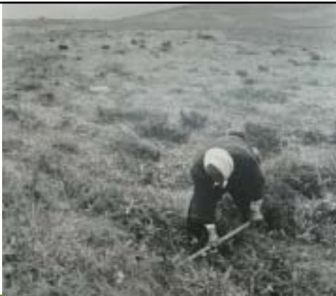
昭和25～26年 場所不明