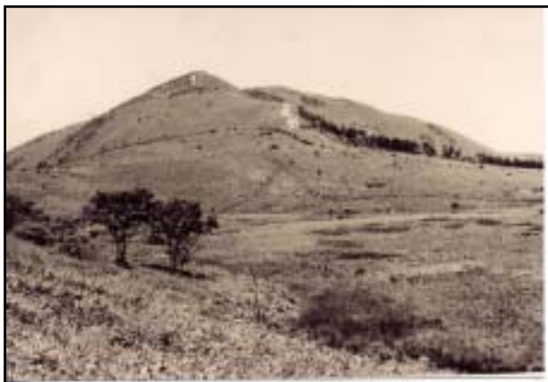
昭和38年頃 鷲ヶ峰