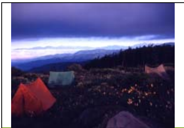
昭和53年 八島キャンプ場