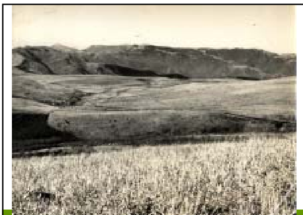
昭和35年頃 八島ヶ原湿原