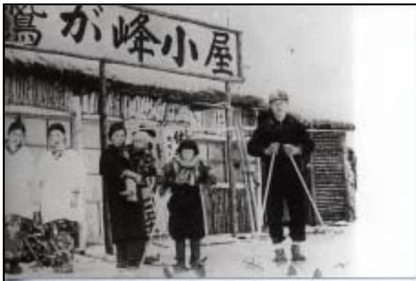
昭和11年 鷺が峰小屋