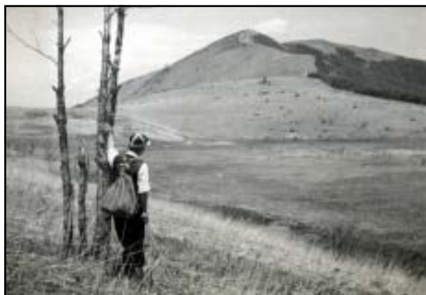
昭和33年 御射山方面から鷲ヶ峰