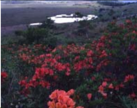
昭和53年 霧ヶ峰下から七島八島を望む