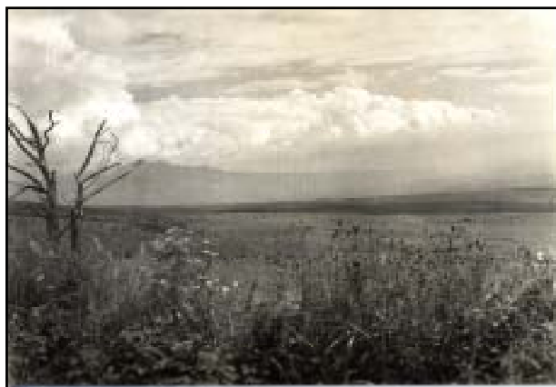
昭和35～36年 ゲーロッパ原 (青沼誠 所蔵)