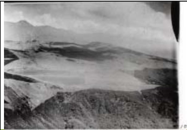
昭和9年 旧御射山方面から見た八島ヶ原湿原 (霧ヶ峰自然保護センター 所蔵)