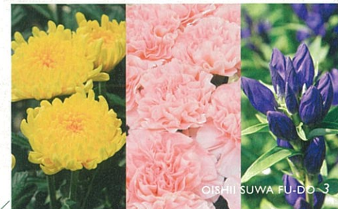
《きく》 《カーネーション》 《りんどう》

昭和初期から花栽培が行われてきた歴史のある産地で、現在は、きく、カーネーション、トルコギキョウ、スターチス等多種多様な切り花、鉢花、花苗が栽培されています。「長野県の花」であるりんどうの栽培は、茅野市米沢地区が発祥の地といわれています。当初、山に自生していた株を掘り取ったり、切って出荷したそうですが、その後、昭和30年代から本格的な栽培が始まりました。