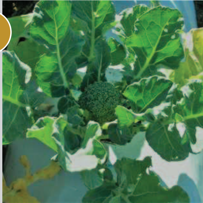
バトニング/早期出らい