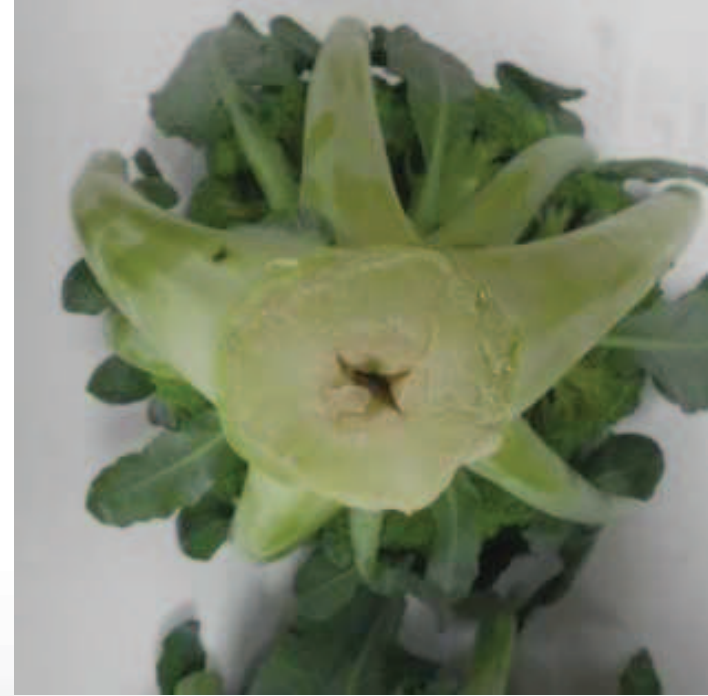
ホローステム/花茎空洞症