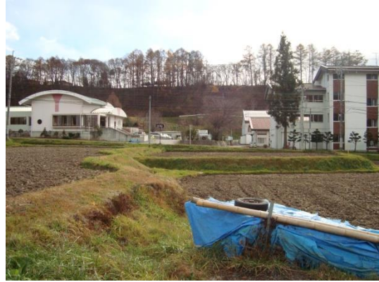
8 柳川入口 01