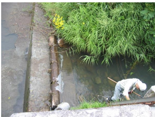
3 柳川 03