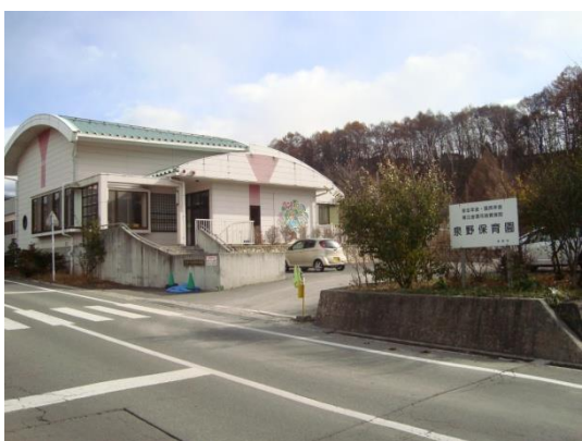
5 柳川・泉野小隣保育園