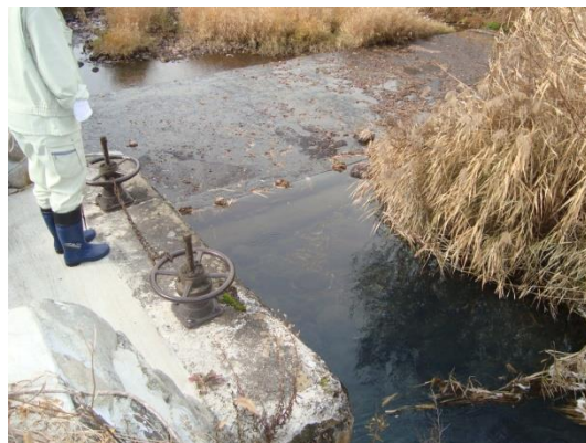
2 柳川 02