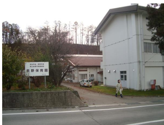
6 柳川・駐車場所・泉野小