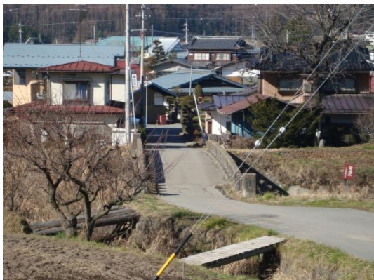
1 上川 01