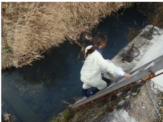
1 柳川 01