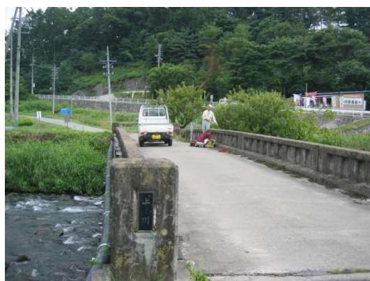
6 上川 06