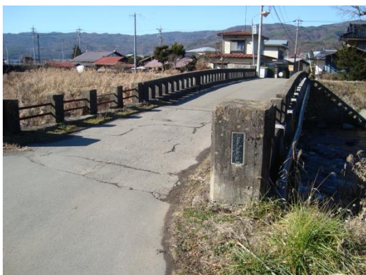
3 上川 03