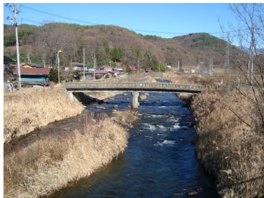
2 上川 02