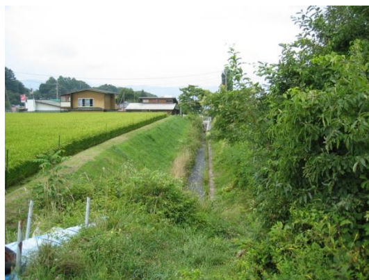
4 柳川 04・流量測定