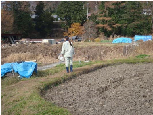
9 柳川入口 02