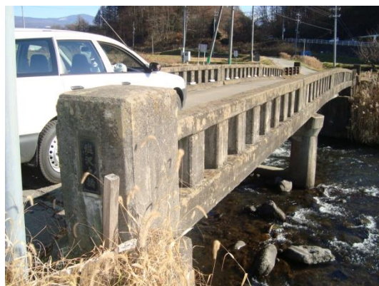
4 上川 04