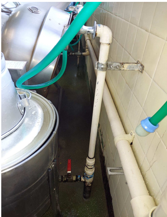
洗米機背面部の給水口