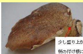
少し盛り上がったつばが柄の付け根にある