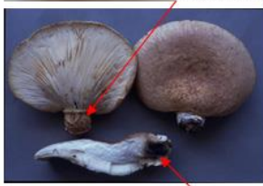
黒いシミがあるものが多い。黒いシミがほとんどないものもあるので注意が必要である。