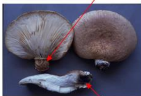
黒いシミがあるものが多い。黒いシミがほとんどないものもあるので注意が必要である。