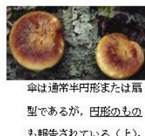
傘は通常半円形または扇型であるが、円形のものも報告されている(上)。