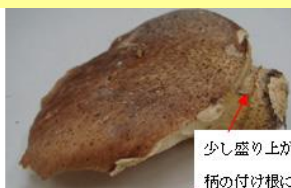
少し盛り上がったつばが柄の付け根にある