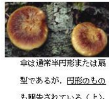
傘は通常半円形または扇型であるが、 円形のものも報告されている(上) 。

黒いシミがあるものが多い。黒いシミがほとんどないものもあるので注意が必要である。