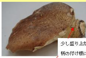
少し盛り上がったつばが柄の付け根にある