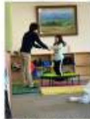
1.5月1日池田町の児童クラブで活動の様子

このプロジェクトは、2020-03-11に募集を開始し、22人の支援により152,500円が資金を集め、2020-03-29に募集を終了しました。