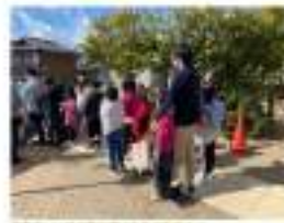
4.児童クラブで活動の様子