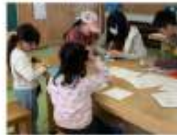
5.児童クラブで活動の様子