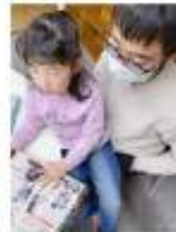
3.児童クラブで活動の様子