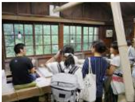
インタビュー/アンケート調査