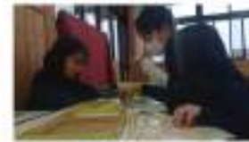
2.児童クラブで活動の様子