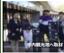
市内観光地へ取材