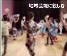
地域芸能に親しむ