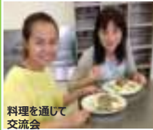
料理を通して交流会