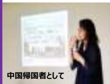
中国帰国者として

第1回は日系ブラジル人中高生、第2回は中国帰国者の中高生対象に、母国についての学ぶ。