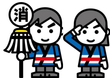
全国消防イメージ キャラクター「消太」