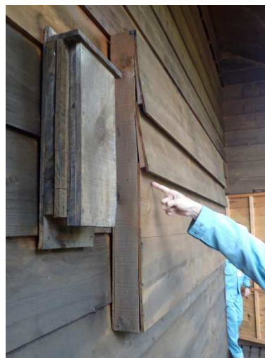
写真-3 小型バットボックス(手前)と大型バットボックス(奥)

※コウモリが休憩やねぐらとすることのできる、コウモリ用の巣箱のこと。鳥の巣箱と違い、スリット状の出入口が底部や側面にあり、内部の天井や壁面にコウモリが掴まる部分がある。