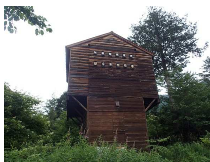
写真-2 乗鞍高原のバットハウス

クビワコウモリを守る会は1995年（平成7年）に発足した。1996年（平成8年）には、民間企業からの助成金を活用し、乗鞍自然保護センターの隣接地にバットハウス※（写真-2）を建設し、繁殖場所の確保を図った。