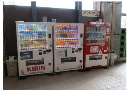
1階エントランスホール