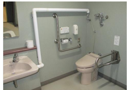
1階身障者用トイレ