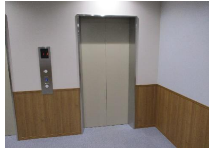
3階エレベーターホール