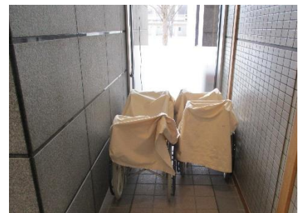
1階エントランスホール