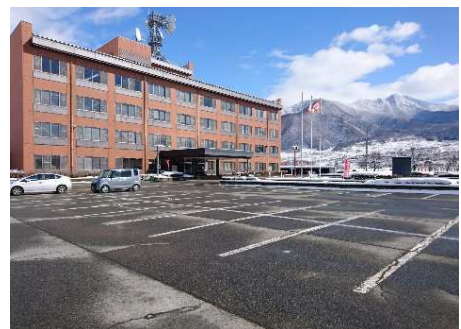
正面玄関側駐車場