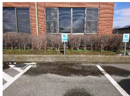
正面玄関側駐車場