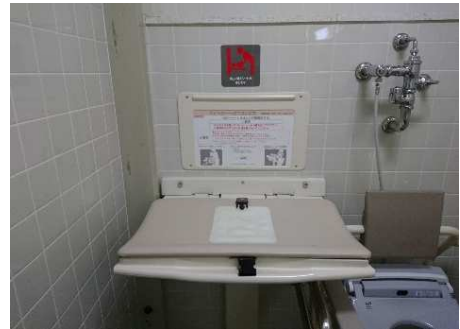
1階多目的トイレ内