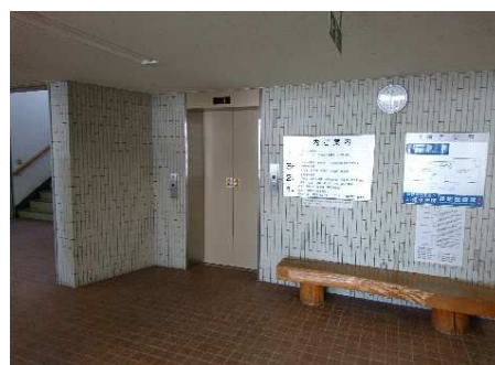
1階エレベーターホール