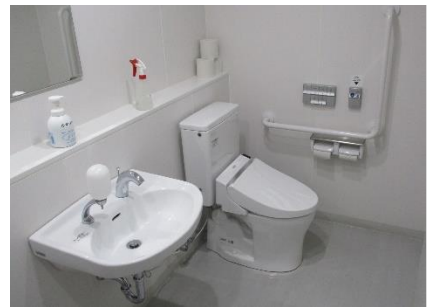
1階だれでもトイレ