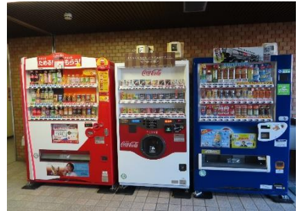
1階エレベーターホール