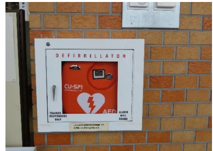
1階エントランスホール