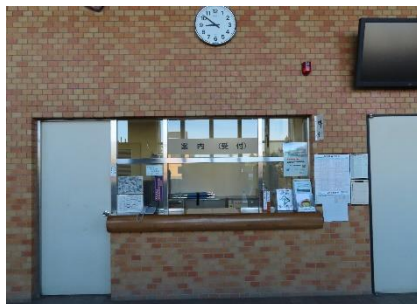
1階エントランスホール