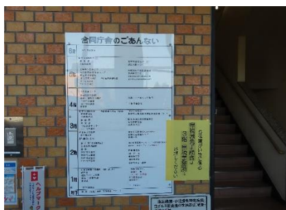
1階エントランスホール