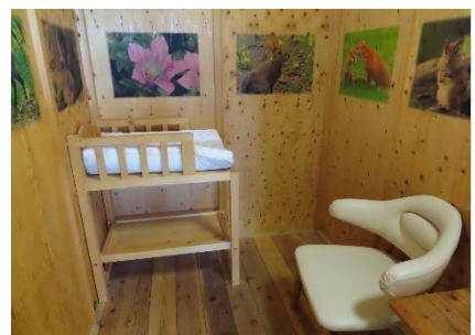
1階県民ホール ベビールーム