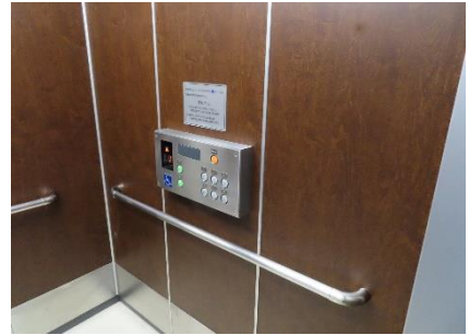
1階エレベーターホール