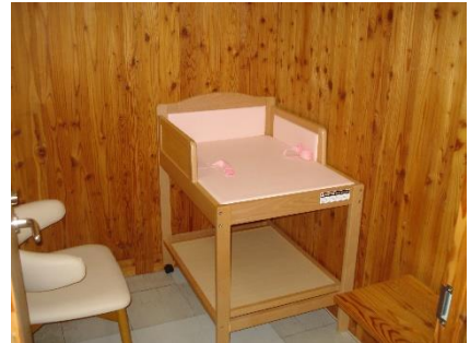
2F赤ちゃん「ほっと」ルーム内