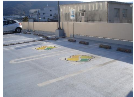
本館南側駐車場（人工地盤）