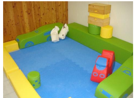
2F赤ちゃん「ほっと」ルーム内