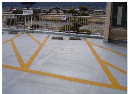
正面玄関前駐車場（人工地盤）