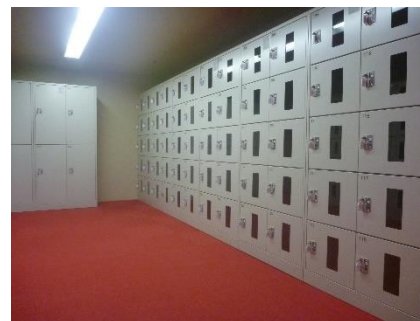
大ホール1階ロッカー室