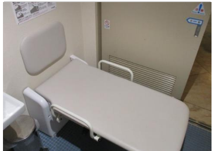
1階車いす対応トイレ (医務室横)