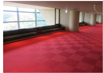
3階大ホールホワイエ