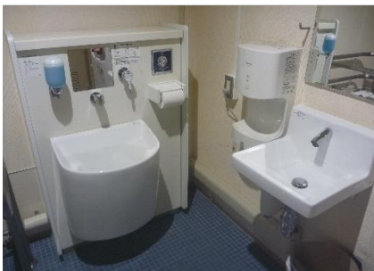
1階車いす対応トイレ (医務室横)