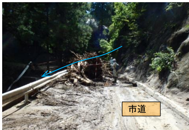
保全対象の被災状況