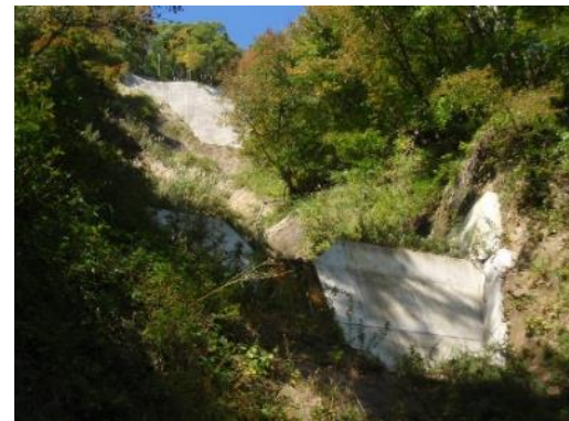
竣工から2年後の状況（平成30年10月撮影）