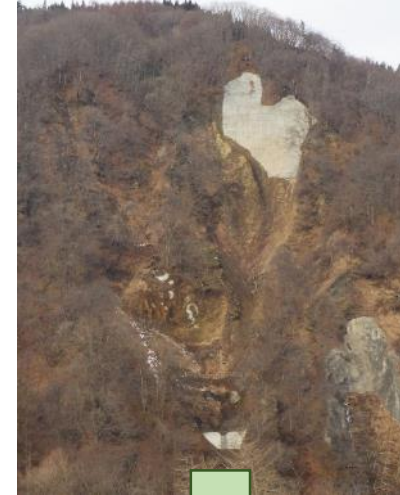
竣工時の状況 （平成28年12月撮影）