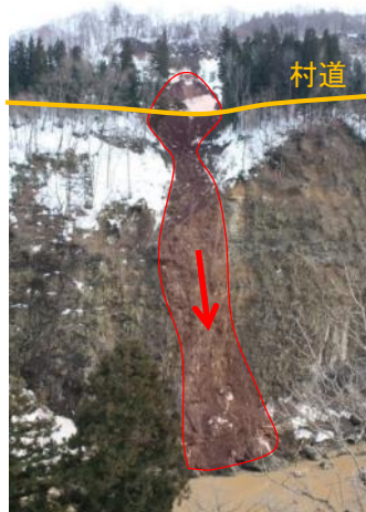
災害発生時の状況（平成23年3月撮影）