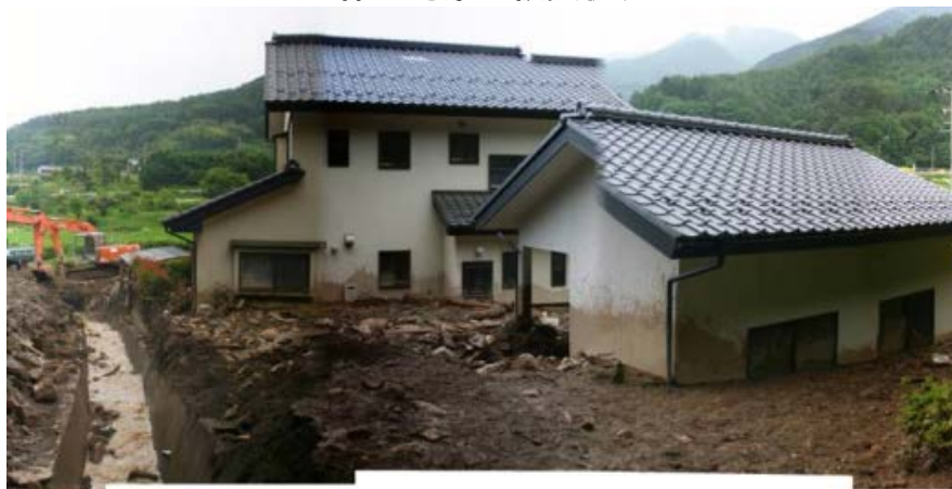
保全対象の被災状況