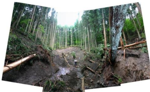
災害発生時の状況（平成22年7月撮影）