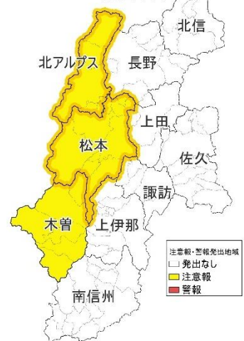
ツキノワグマ 出没注意報・警報 発出マップ

(県民の皆様・長野県を訪れる皆様へ) https://www.pref.nagano.lg.jp/yasei/bear.html