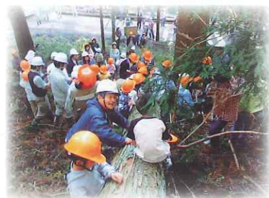
社員の家族も森林整備を体験