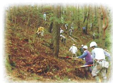
見違えるように森がきれいに