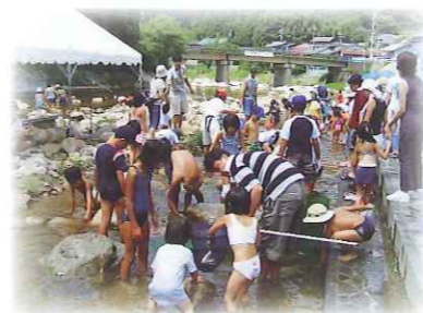
地元との交流も大きな楽しみ