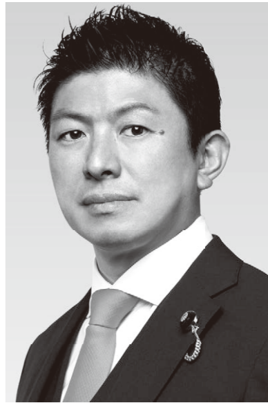
参政党代表・神谷宗幹