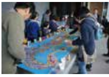
アートワークショップの様子 (2017.4.2)