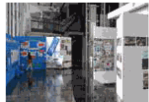
LIUB ちの 啓発パネル展示の様子 (2017.3.19~4.16)

ライト・イット・アップ・ブルー 「Light It Up Blue」 ブルー 青でつたえたい 私たちの想い