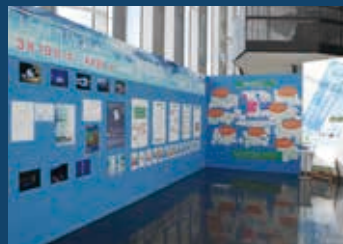
LIUBちの 啓発パネル展示の様子 (2016.3.19～4.9)