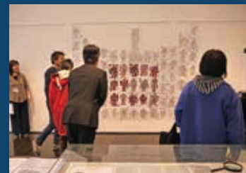
茅野市美術館「ザワメキアート展」の様子 (2017.1.5～1.16)