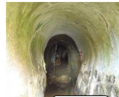
涌井隧道 (坑内崩落)