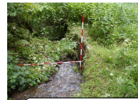
涌井用水 (自然河川から直接取水)