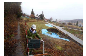
前堰工区(被災状況) 「溢水による農地災害」