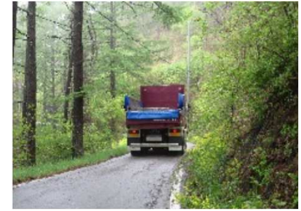
車両同士のすれ違いが困難