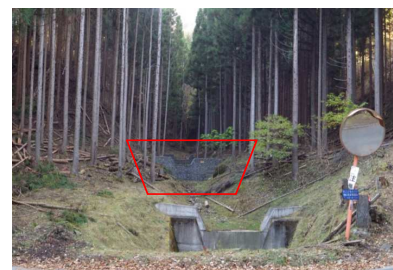
谷止工の施工により溪流の安定を図った。(H20施工 手前は他所管)