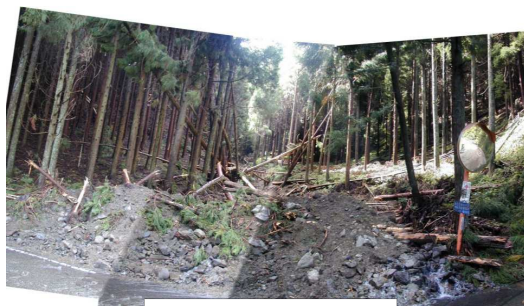
溪流から県道に土砂が流出