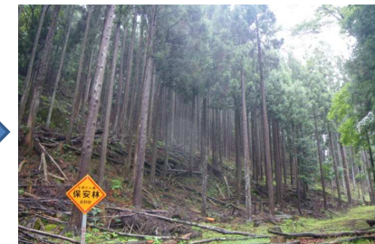
本数調整伐により林床植生が回復しつつあり、表土の流出を抑制している。