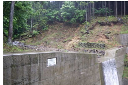
谷止工の施工により溪床の土石の安定とともに溪岸の植生が回復している。(H22施工)