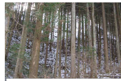
過密状態のため林床植生が乏しい(スギ人工林)