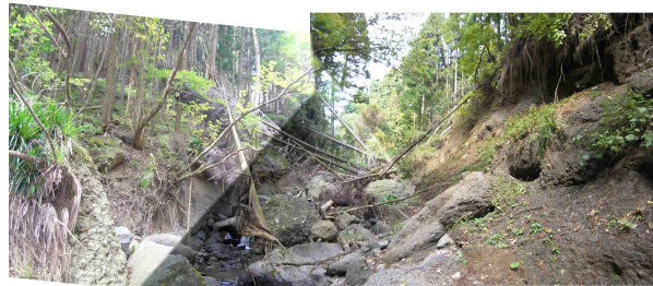
溪床には不安定土砂が堆積し、溪岸が浸食されていた。