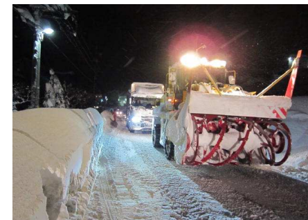
白馬村における冬期積雪状況