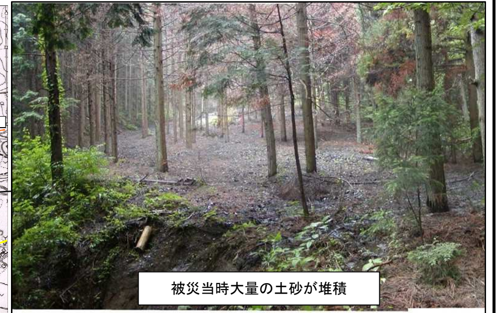
被災当時大量の土砂が堆積