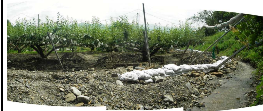
平成18年豪雨災:大量の土砂が農地へ流出