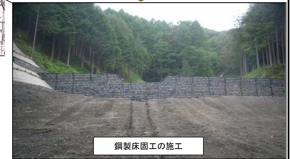
鋼製床固工の施工